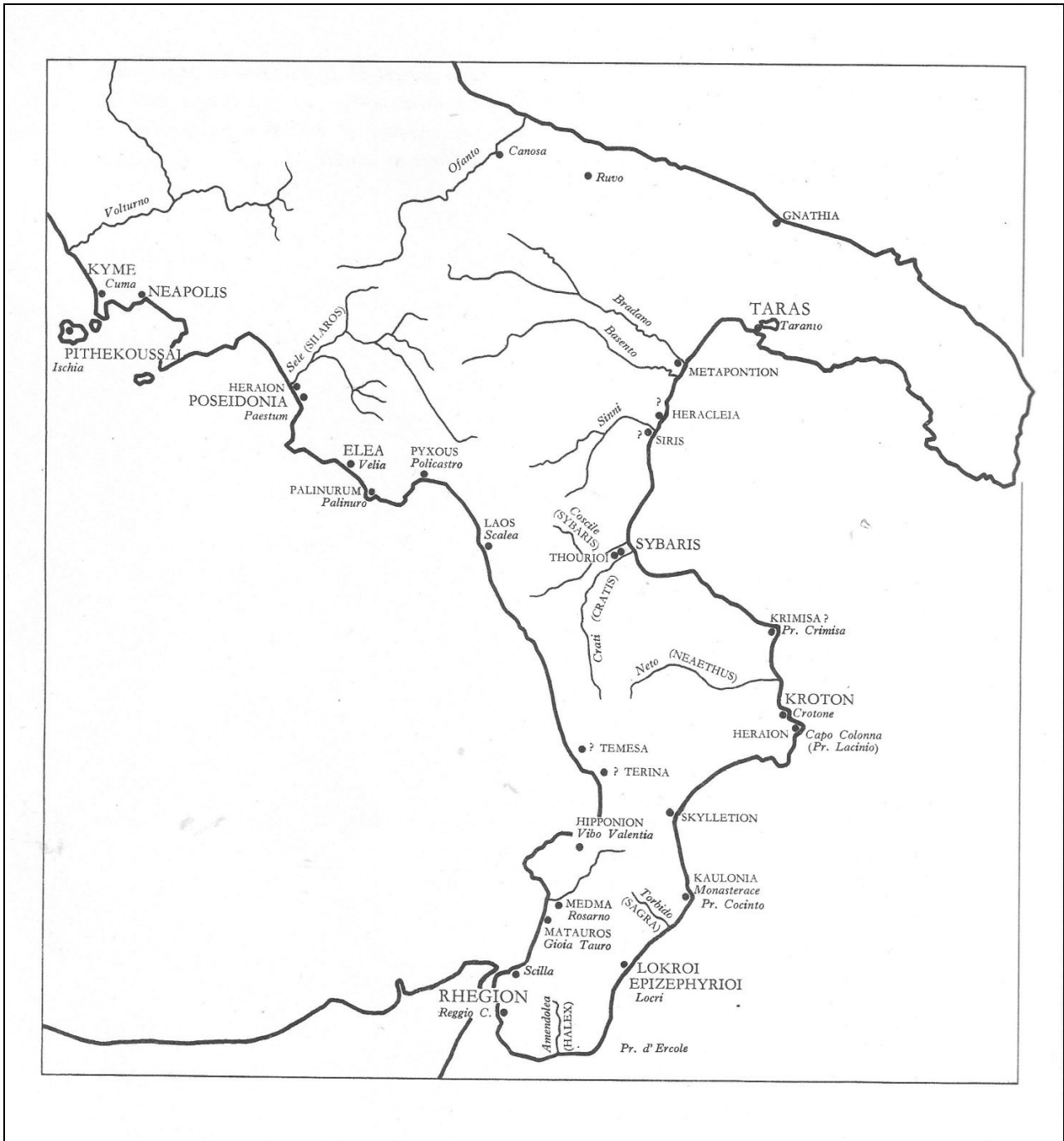
Le principali località della Magna Grecia disegnate da Zanotti Bianco per il suo volume La Magna Grecia , cit.