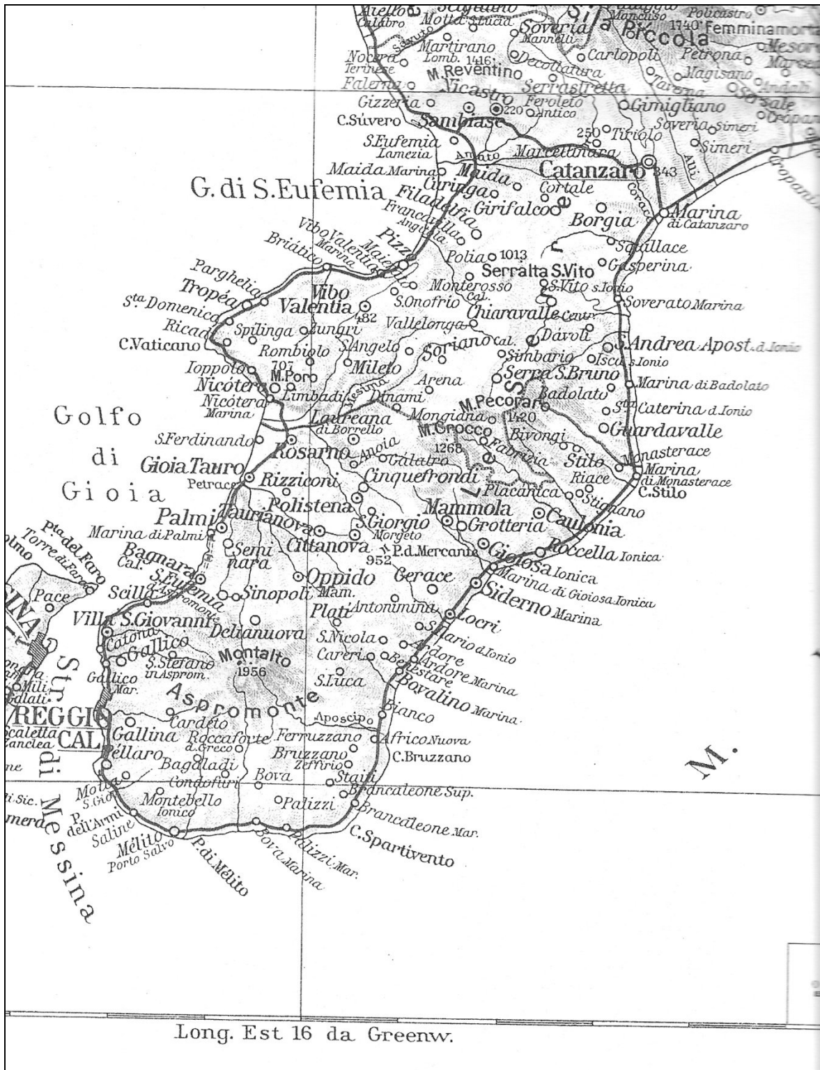
La zona dell'Aspromonte, da L. Gambi, La Calabria , UTET, Torino 1965.